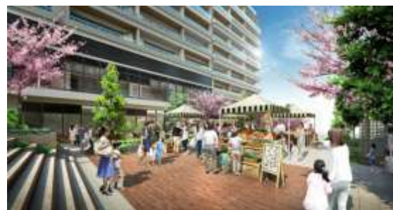
「CO-NIWAたまプラーザ」イメージ