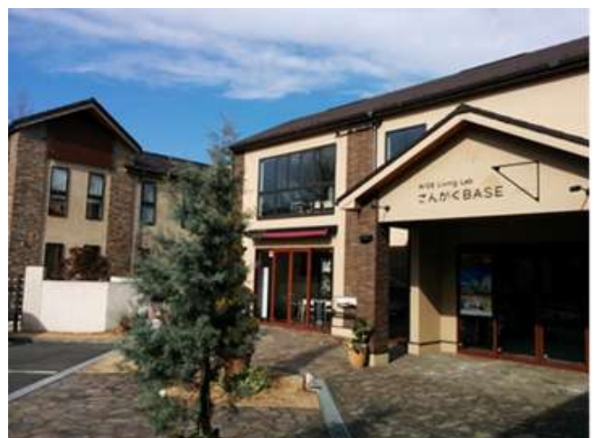
WISE Living Lab 中央棟 (右) と西棟 (左)