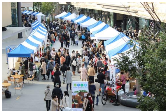
二子玉川ライズ「ふたこ座」(2016年)の様子