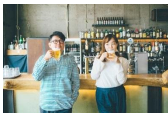
ビューティフルハミングバード