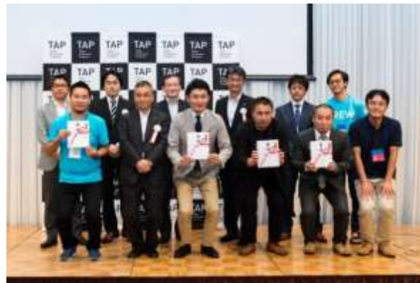
2016年度説明会および最終審査会の様子