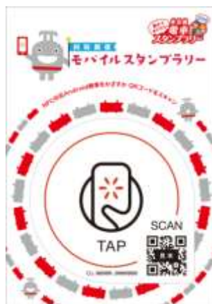
▲モバイルスタンプラリースマートプレート