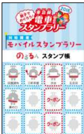
▲モバイルスタンプ帳