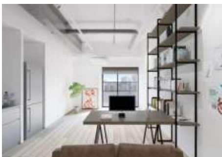
コレクティブハウス住戸 イメージ