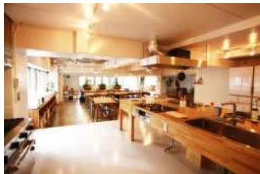
「食」をコンセプトにした単身者向けシェアハウス