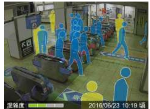
(配信画像イメージ)