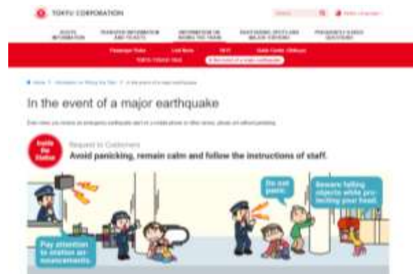
震災時の対応について

■英語版制作会社 株式会社あたらす二十一 ( http://at21.jp/ )