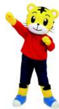
しまじろう

概要:東急線沿線のショッピングセンターにあるラリーポイントをまわって、スタンプを3つ集めよう!スタンプを全部集めると、絵が完成します。完成した絵にかかれたキーワードを使って、映画グッズプレゼントに応募できます。スタンプラリーの対象施設は、二子玉川ライズ・ショッピングセンター・武蔵小杉東急スクエア・たまプラザ テラスです。3月27日(日)には、しまじろうがフェスティバルコートに遊びに来ます。映画に出てくる曲に合わせて、みんなで一緒に踊ったり、歌ったりして遊ぼう! ※詳細は「たまプラザ テラス」ホームページをご確認ください。