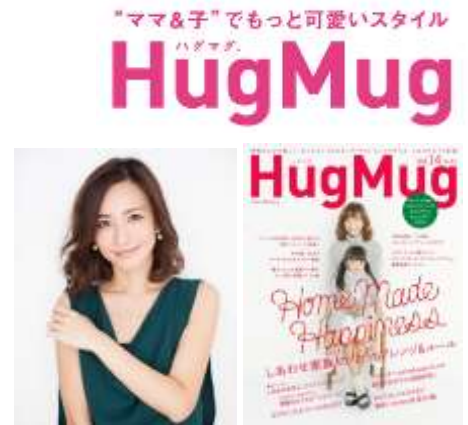
※表紙イメージはHug Mug vol.14 (2015/11/7発売号)のものです

第2部では、新生活シーズンに向けたインテリアのことや、おうちでお子さまと楽しめる工夫などをご紹介します。