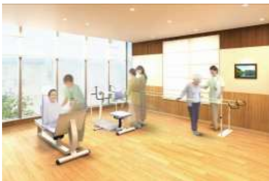
トレーニングスペース イメージ

※ 要介護認定における要介護度区分。要介護2～3は、「屋内での生活は何らかの介助を要し、日中は座ったまま過ごすことが多い」レベル。排泄や食事について何らかの介助が必要もしくはひとりでできない、歩行や移動の動作に何らかの介助が必要とする、など身体的な介護を要する状態。