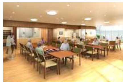
リビング イメージ