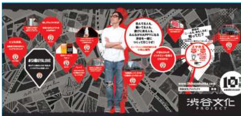
▲掲出ポスターイメージ

※場所やモノに貼ってアプリからセットアップするだけで、さまざまなオンライン情報やサービスと直接つながります。バッテリーを使用しないためメンテナンスが不要、利用者は専用アプリケーションをインストールせずに情報を入手できるといった特徴を持つ。 ※NFCが利用できるのは、アンドロイド携帯だけです。また、機能設定でNFC機能を「ON」にしていないと利用できません。