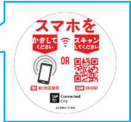
▲「スマートプレート」タッチポイントイメージ