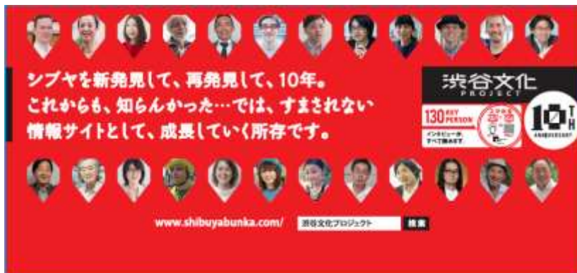
▲ポスターイメージ