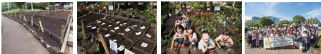
公園に新たな花壇を作り、多世代が集まる憩いの場を作る企画