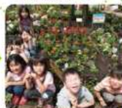
子ども花壇が完成しました!