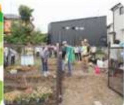
空き地の雑草を抜き、土を掘り起こして、花壇とビオトープを作りました