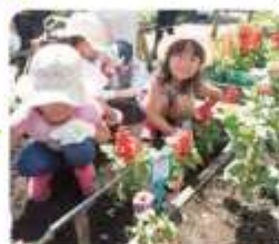
好きな場所を選んで、花の苗を植えました