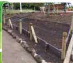
土を入れ替えて、子ども花壇の整備がスタート!