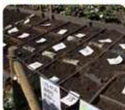
区分けをして、1人ひとりの専用花壇を作りました