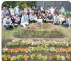
近隣の方を招いて、花や植物の栽培会や鑑賞会を開催!