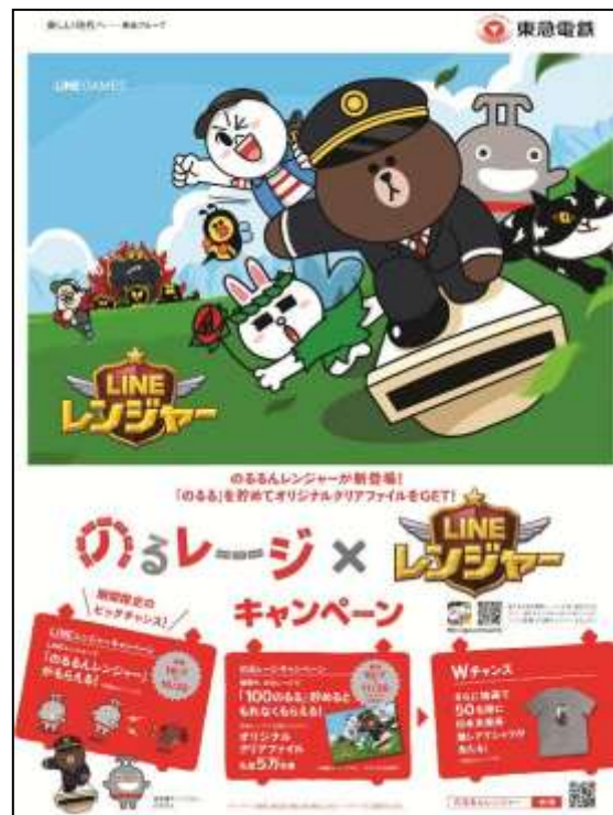
ポスターのイメージ