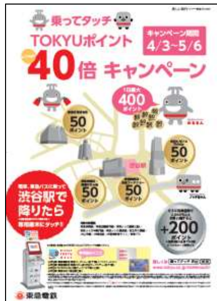
ポスターのイメージ