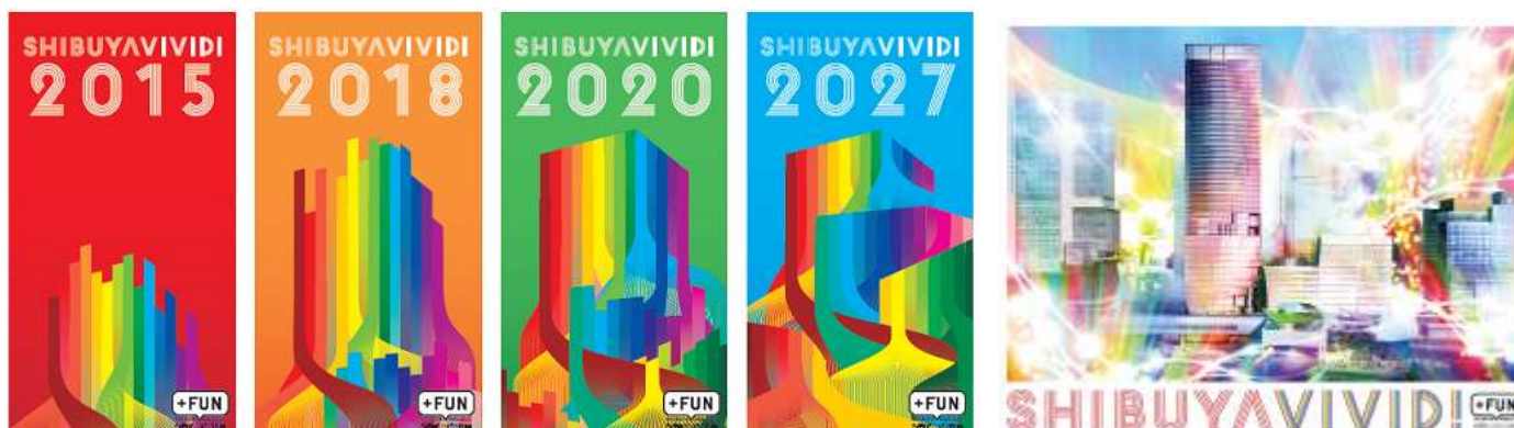
※図はイメージです

掲出箇所 渋谷駅東口2階デッキおよび仮設通路 ※今後、東急百貨店東横店解体工事等においても連携したデザイン装飾を実施し、一体感のある賑わいづくりを演出します。