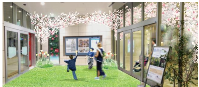
▲1F 正面入り口のイメージ

武蔵小杉東急スクエアの館内に桜のウェルカムゲートをイメージした「Blooming Gate」が登場します。