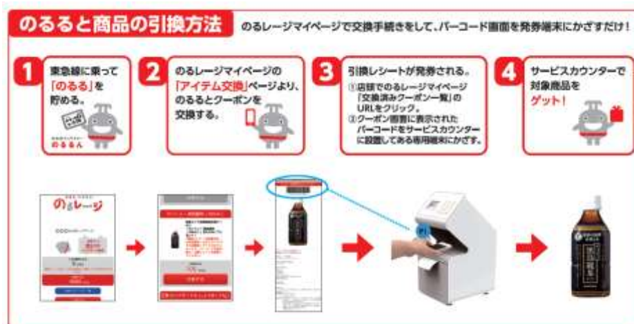
サービス実験のイメージ