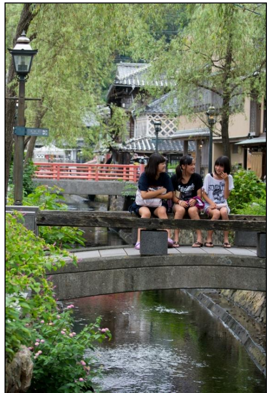
「下田の人々と会おう旅」