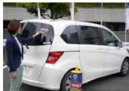
オリックスカーシェア