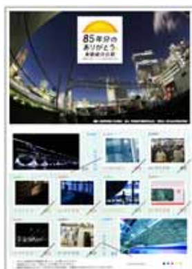
フレーム切手シート

東横線 渋谷駅メモリアル写真集“DREAM TERMINAL”のために鉄道写真家・中井精也さんが撮り下ろした渋谷駅の写真を、2,000セット限りのフレーム切手シートにします。オリジナルクリアファイル付。