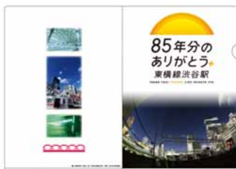
オリジナルクリアファイル