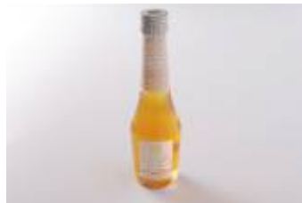
「飲む酢・デザートピネガー・三春 (桃・梅・桜)の酢」 ¥735 (60ml)