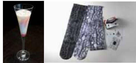
alice a uaaのオリジナルカクテルとプレゼント

飲食フロア7階「TABLE 7(テーブル セブン)」・ 11階「スカイロビー」の一部店舗では、バカルディ・ジャパンと協力し、MBFWTに参加する6ブランドをイメージした6種類のオリジナルカクテルを期間限定でご提供する「MBFWT Designers Cocktail Collection」を開催します。 該当商品をご注文のお客さまには、バカルディ・ミニチュアボトルを先着でプレゼントするほか、各ブランドからの豪華賞品を抽選でプレゼントします。 詳細は<別紙資料>をご参照ください。