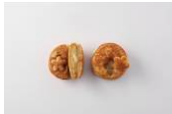
「焼きいもどらやき 安納芋春さくら」 ¥137