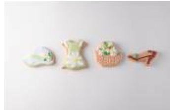
「2013 春 ファッション セット」 ¥1,260