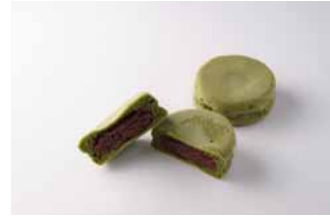
地下2階「パティスリー・サダハル・アオキ・パリ」 「東京焼きマカロン ショコラ」

商業施設「ShinQs」のスイーツフロアでは、「Mercedes-Benz Fashion Week TOKYO」(以下、MBFWT)と連動して、期間限定のスイーツコレクション「Sweets Runway vol. 7」を展開します。 詳細は<別紙資料>をご参照ください。