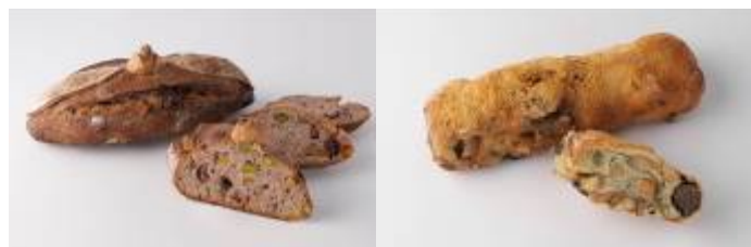
「バラと柚子のカンパーニュ」 ¥819 (左)