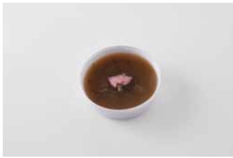
「あきよし さくら」 ¥231