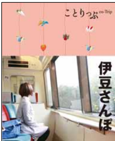
昭文社が出版する「ことりっぷ 伊豆さんぽ」の表紙(イメージ)

なお、この「ことりっぷ 伊豆さんぽ」は電子書籍アプリも同日より展開。昭文社電子ブックアプリ「ことりっぷアプリ」内ブックストアにて提供が開始されます。