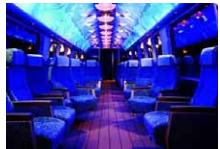
<ロイヤルボックス車両>