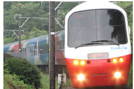
<伊豆急行「アルファ・リゾート21」>