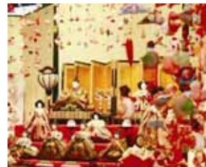
<雛のつるし飾りまつり>