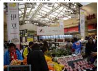
<昨年開催時の様子>