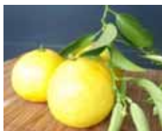
<ニューサマーオレンジ>