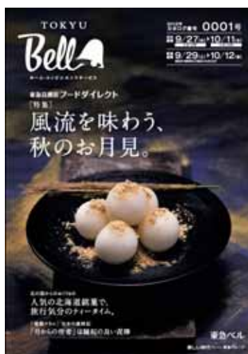
カタログイメージ

毎週1回のペースでお届けする「週刊カタログ」は、A4のマガジンサイズで、季節感や食に関連した楽しいコンテンツも掲載しています。週刊カタログのほかにも、「季刊カタログ」「リカーダイレクト お酒カタログ」(どちらも半年に1回)を発行し、無料でお手元にお届けします。