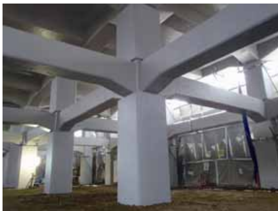
耐震補強された高架橋

1995年に発生した阪神・淡路大震災で鉄道施設が大きな被害を受けたことから、同年、国土交通省(旧運輸省)から高架橋やトンネルなどの耐震性を高める工事の通達が出され、対象となる箇所耐震補強を完了しています。また、東急線では、その後に国土交通省から出された通達基準に加え、災害時の復旧困難性や老朽化なども考慮して、通達基準対象外の箇所も耐震性を検証し、順次補強工事を行っています。さらに、東日本大震災を踏まえて、今後発生が予想される首都直下地震に備え、現在進めている駅・高架橋・トンネルなどの耐震補強計画を見直し、工事完了時期を2年間前倒しました。また、これまでの取り組みから対象範囲を拡大して、高架橋・トンネル・盛土・擁壁などのさらなる耐震対策にも着手します。