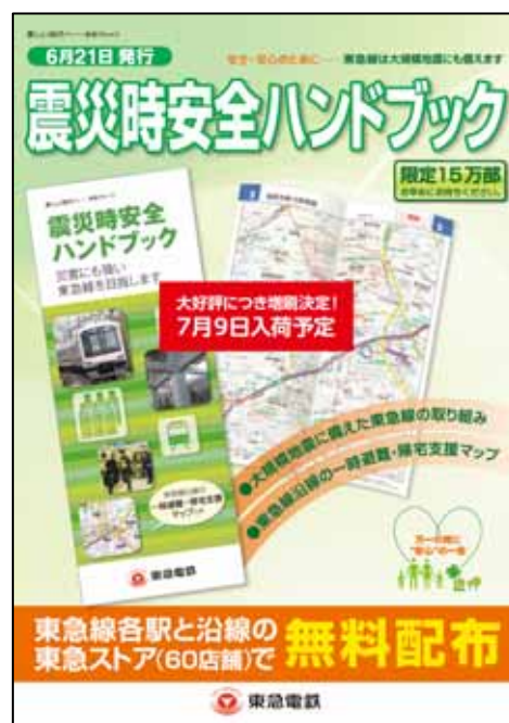
駅で掲出するポスター