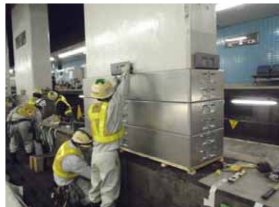
地下駅での耐震補強