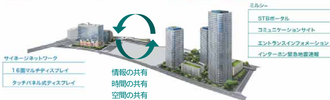
二子玉川ライズ タワー&レジデンス

「ミルシーフォーラム」(2009年6月設立)マンション事業者、ケーブルテレビ事業者によるマンション居住者向けの商品・サービスを開発する共同体。 参加企業：東京急行電鉄、相鉄不動産、ナイス、東京ベイネットワーク、YOUテレビ、横浜ケーブルテレビジョン、イツコム