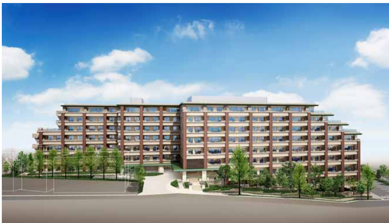
東急ウェリナ大岡山外観