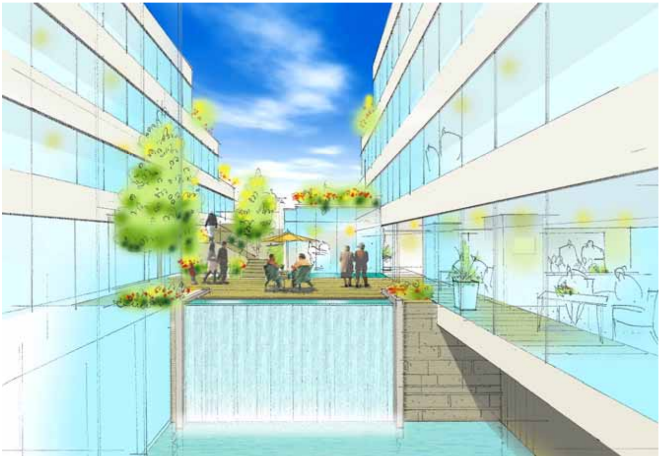
東急ウェリナ旗の台 中庭

所 在 東京都品川区旗の台2丁目1184番他 敷地面積 約2000㎡ 開業予定 2012年 秋 戸 数 約70戸 構造・規模 鉄筋コンクリート造・地上5階 地下1階建 共用施設 ダイニング、ラウンジ、サポートリビング、健康管理室、多目的ホール、大浴場等 イメージ図