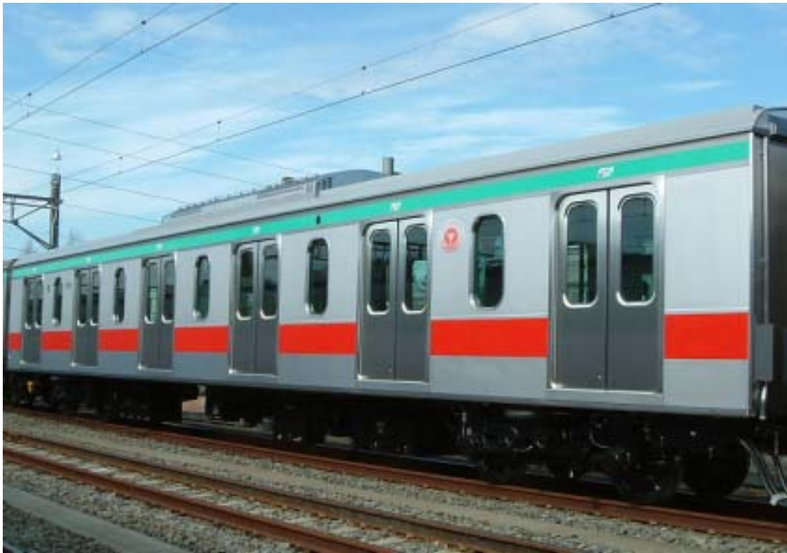
6ドア・座席格納車両の車体側面