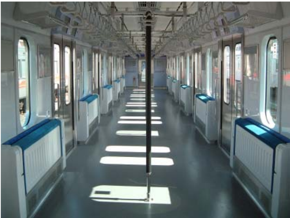
座席格納時の車内