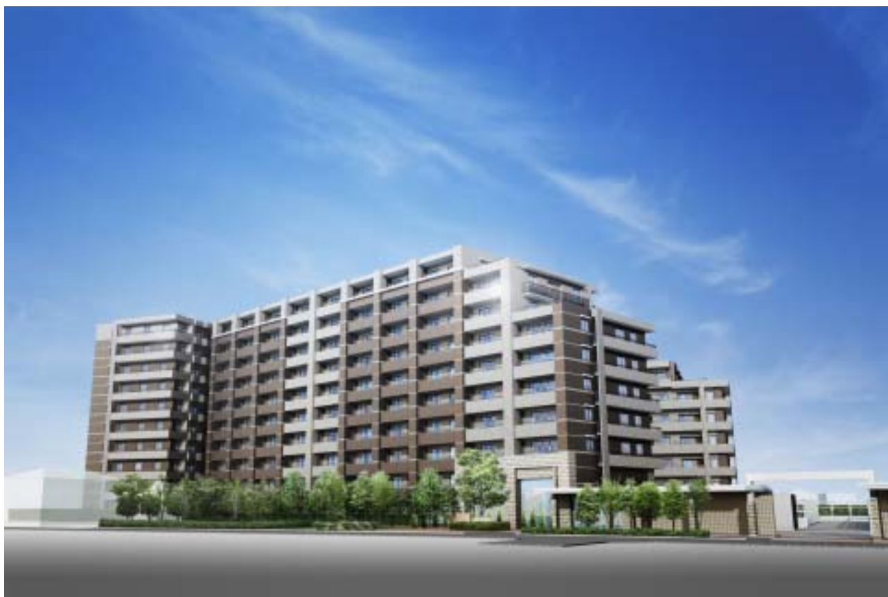
「ブランチシティ田園ヒルズ」完成予想図