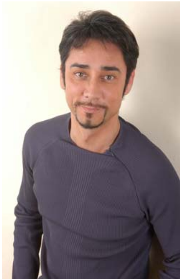
クリス・ペプラー (ナビゲーター)