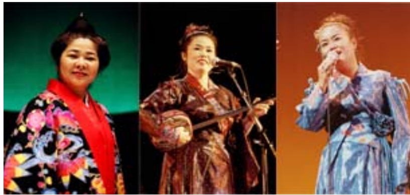
さんさら (沖縄三線)