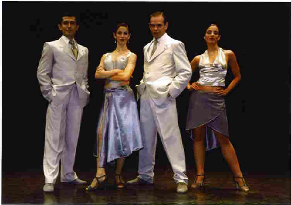
オルケスタ・ノクトウルナ・デ・ブエノスアイレス&コルポラシオン・タンゴ (アルゼンチン)