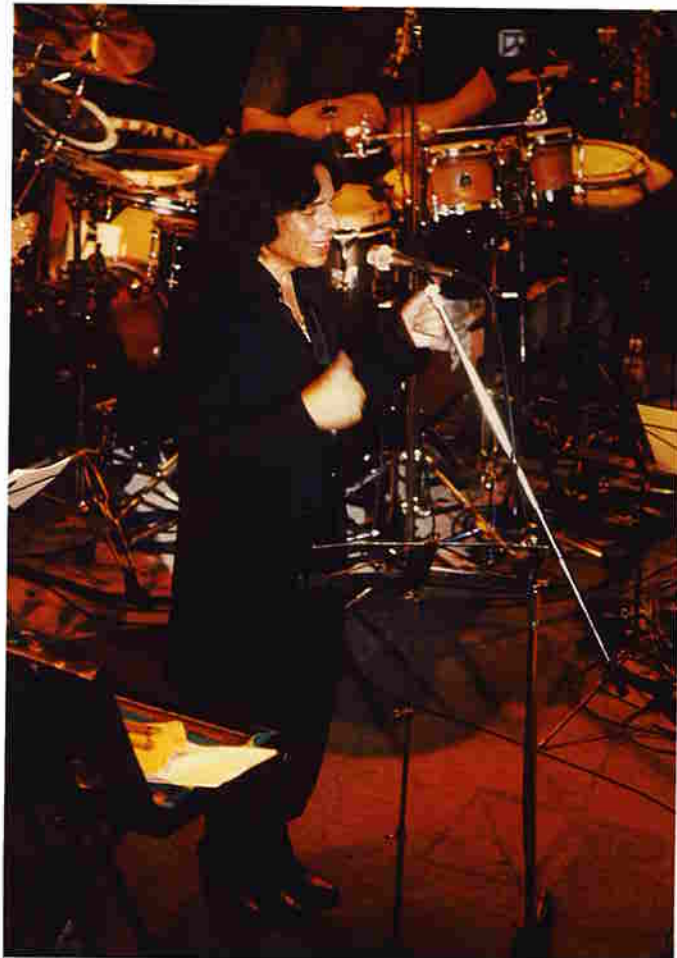
ホルヘ・クンボ (アルゼンチン)