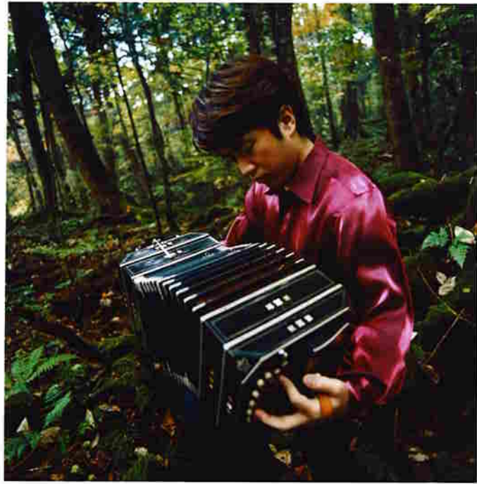
小松亮太&オルケスタ・ティピカ (日本)